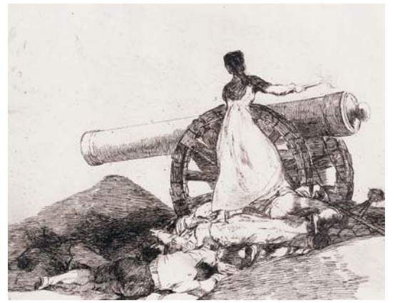
Imagen en el verso: del Siglo de Oro al Siglo XX