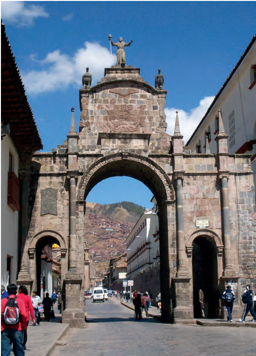
Anónimo Arco de triunfo conmemorativo de la Confederación Peruano- Boliviana (Cuzco), 1836-1839