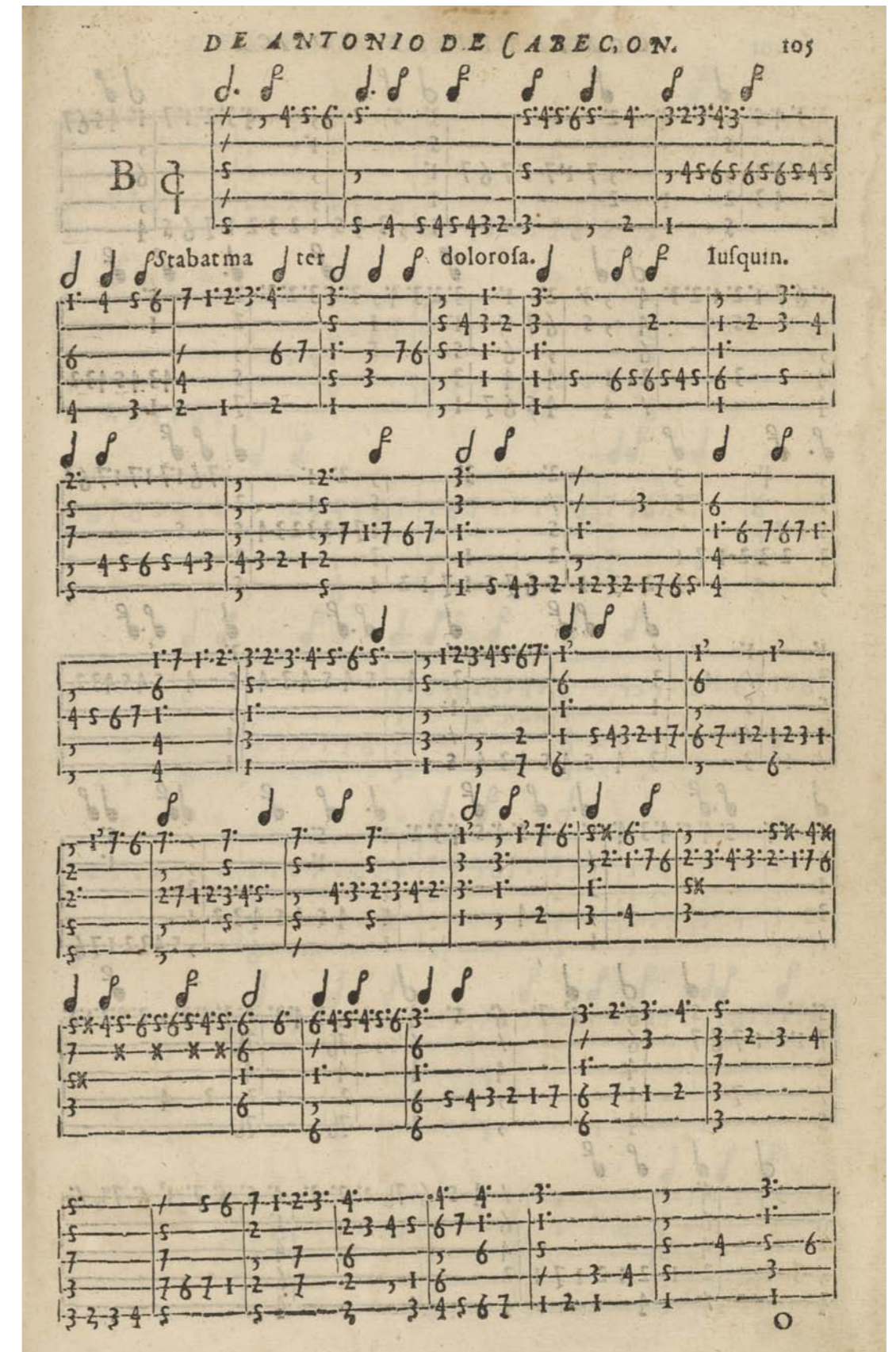
R/3891, fol. 105r