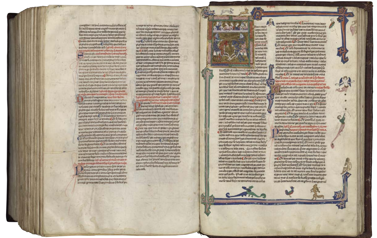
Vitr/4/6, fols. 416v-417r

La descripción de la encuadernación la podemos iniciar indicando que las tapas son de madera y están recubiertas de piel de cabra rojiza; la estructura decorativa no es simétrica aunque los encuadramientos exteriores son semejantes y están formados por once filetes paralelos en las bandas horizontales y nueve en las verticales, seguidos de una orla en la que se repite un hierro gótico con las letras «AO», flanqueadas a ambos lados por tres filetes. En la tapa anterior, la parte central está decorada con una composición de hierros sueltos mudéjares que dan lugar a un escudo heráldico, constituido en su parte exterior por la repetición de un arquillo con aspecto de cordón seguido de dos filetes que forman una cinta, la cual se va entrecruzando en las esquinas y en la parte central de las bandas verticales y horizontales simulando cadenas, elemento que aparece en el escudo heráldico de Álvaro de Zúñiga; a continuación se forma otro encuadramiento mediante la repetición de peltas y la partición central del escudo, terciado en bandas, formado por peltas y flanqueado por tres filetes paralelos; sobre el escudo se aprecian dos triángulos unidos y ornamentados con lazos simples redondeados con forma de cordel y flanqueados por tres filetes. La tapa posterior está decorada en su tercer encuadramiento por la repetición de la letra gótica estilizada «V» y flanqueada por tres filetes paralelos a cada