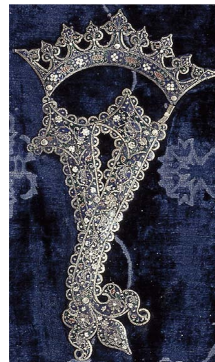
Vitr/4/6, detalle de la funda