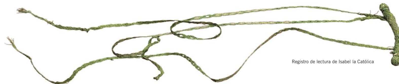
Registro de lectura de Isabel la Católica