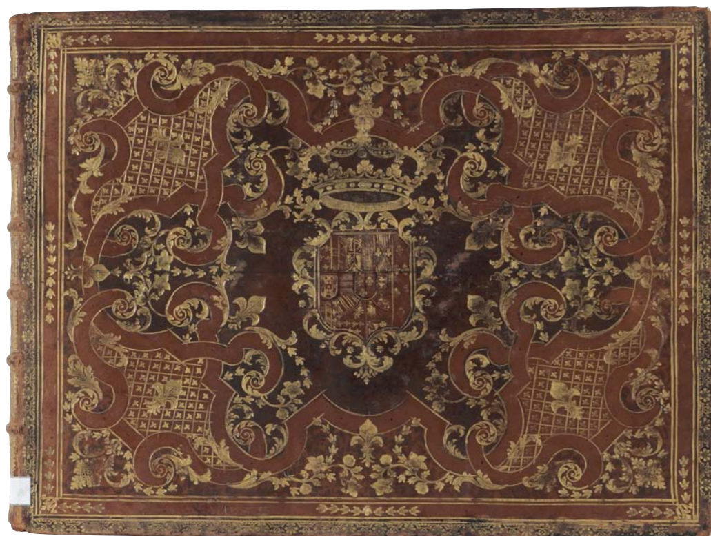
ER/1974, tapa delantera

Súbdito de Carlos III, cuya coronación como soberano de Nápoles y Sicilia había grabado en 1735, al año siguiente Vasi se estableció en Roma donde montó un taller muy importante en el que estuvo brevemente el joven Piranesi. En 1748 el rey le autoriza a instalarse en el palacio Farnese de Roma, y como lógica muestra de agradecimiento, el grabador dedica este volumen Delle magnificenze di Roma antica e moderna a Isabel de Farnesio. Es el cuarto de una serie de diez álbumes grabados a lo largo de catorce