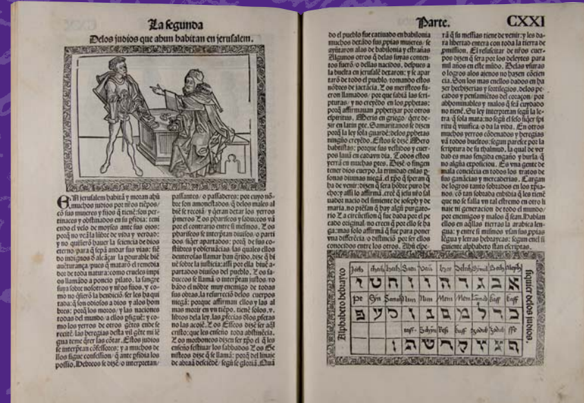
Bernhard von Breidenbach: Viaje de la Tierra Santa (1498).