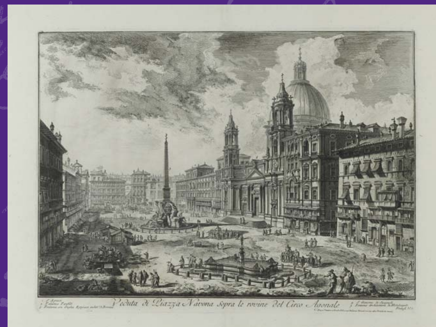
G.B. Piranesi: Vista de la Plaza Navona en Roma (1751).