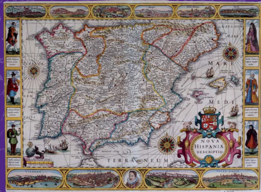
Mapa de España orlado con vistas de diferentes ciudades y figuras (1610?).