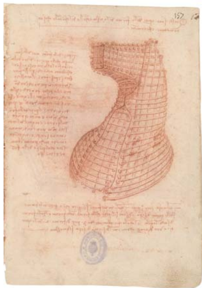
Dibujo de Leonardo en el Códice Madrid II (finales del siglo XV).

Junto a la tecnología informática y digital, que está cambiando los modos de entender una Biblioteca Nacional en el presente y en el futuro, en esta sala se prestará también atención a otras tecnologías al servicio de la conservación y difusión de la información y del conocimiento: la propia tecnología de la escritura que permitió en el siglo XIX copiar códices y libros impresos para su conservación y difusión, la de la fotografía, que ha hecho posible el facsímil y, por último, la tecnología de conservación y reproducción del sonido, a partir del invento revolucionario de Edison patentado en 1877: el fonógrafo.