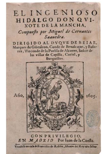
Portada de la edición príncipe de la Primera parte del Quijote (1605).

No es posible resumir en una exposición los últimos trescientos años de una institución tan compleja como la Biblioteca Nacional de España. Fuera de sus vitrinas han quedado los directores y bibliotecarios mayores que han dirigido sus pasos, las diferentes sedes que la albergaron hasta llegar al Palacio de Biblioteca y Museos Nacionales del Paseo de Recoletos, la legislación que ha ido concretando su funcionamiento a lo largo de los años, así como muchas de las colecciones que han enriquecido sus fondos. Una historia, la de la Biblioteca Nacional, que siempre se ha imbricado con la historia de España; una historia que siempre ha estado muy pendiente de los cambios tecnológicos que se han ido sucediendo en los últimos tres siglos. A todos estos aspectos les hemos dedicado este espacio final: una cronología en que pueden recorrerse los 300 años de la Biblioteca Nacional de España a partir de sus hitos más significativos.