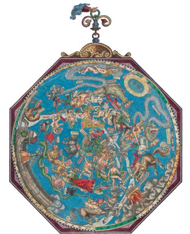
Petrus Apiano: Astronomicum Caesareum (1540). Detalle.

La exposición se organiza en cuatro secciones: [1] La Biblioteca Nacional de España en su historia, [2] la tecnología al servicio de la información y el conocimiento, [3] la Biblioteca Nacional de España por dentro y [4] los 300 años de la Biblioteca Nacional de España: línea del tiempo.