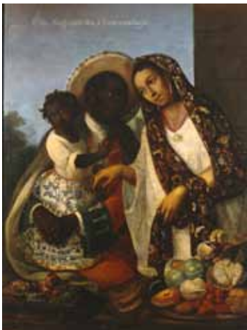
Miguel Cabrera. De negro e india. China cambuja , 1763 De la serie Las castas mexicanas Óleo sobre lienzo. 134 x 103 cm Museo de América, Madrid