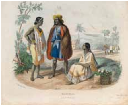
A. Guynemen (grab.) Indiens du Guatemala Xilografía sobre papel 17 x 21 cm

En: Gabriel Lafond de Lurcy, Voyage autour du Monde et naufrages celebres , París, Pourrat Frères, 1843-1844 Biblioteca Nacional de España