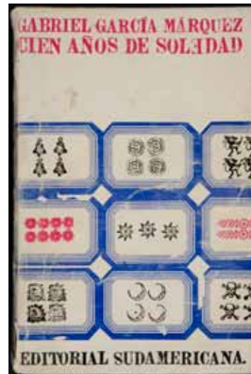
Gabriel García Márquez Cien años de soledad, Buenos Aires, Sudamericana, 1967 Biblioteca Nacional de España