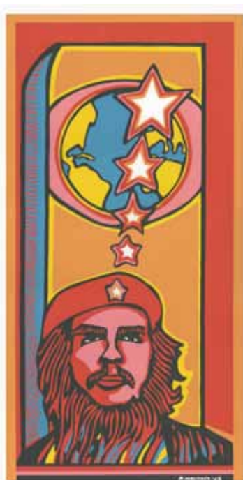
Raúl Martínez Ernesto «Che» Guevara , 1968 Serigrafía sobre papel 50 x 75 cm Colección particular