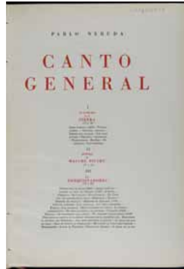
Pablo Neruda Canto General. Guardas ilustradas por Diego Rivera México, Talleres Gráficos de la Nación, primera edición especial y limitada, 1950 Biblioteca Nacional de España