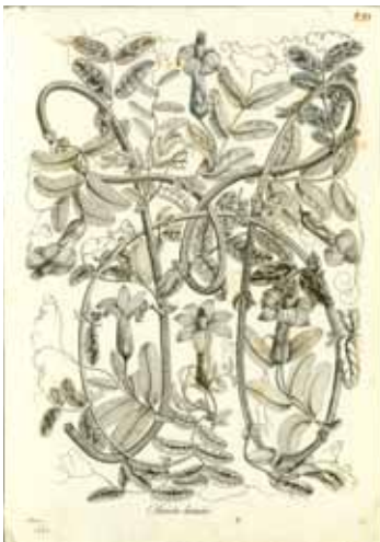
Salvador Rizo Mutisia clematis De la expedición botánica de José Celestino Mutis, 1783-1808 Acuarela sobre papel 54 x 38 cm Real Jardín Botánico (CSIC), Madrid