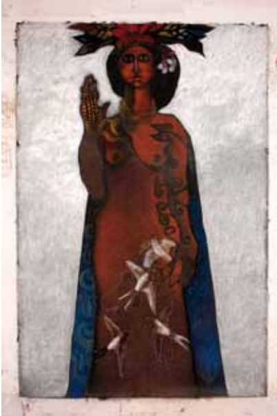
Miguel Carini Madre tierra , 2010 Pastel sobre papel 150 x 100 cm Colección del artista

En 1980, solo México, Costa Rica, Colombia y Venezuela tenían regímenes democráticos. Sin embargo, diez años después la relación se había transformado completamente y únicamente Cuba y Haití estaban al margen de la democracia.