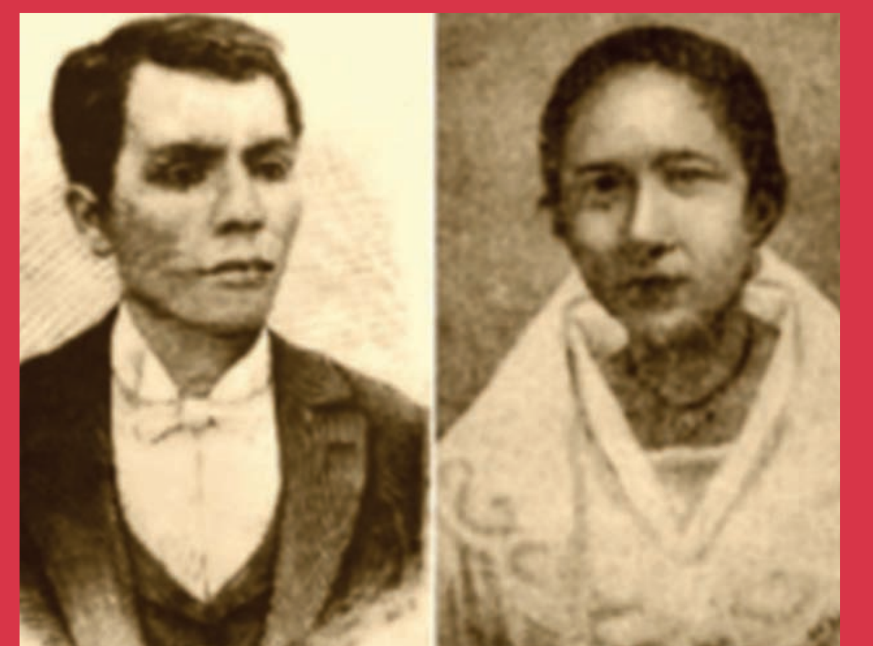
ANDRÉS BONIFACIO Y GREGORIA DE JESUS

Andrés Bonifacio se casa con Gregoria de Jesús en la Iglesia de Binondo. Una semana después, contrajeron matrimonio según el rito del Katipunan .