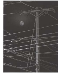
Out of Sight Mark Mahoney captures the Polar Night of America's far north