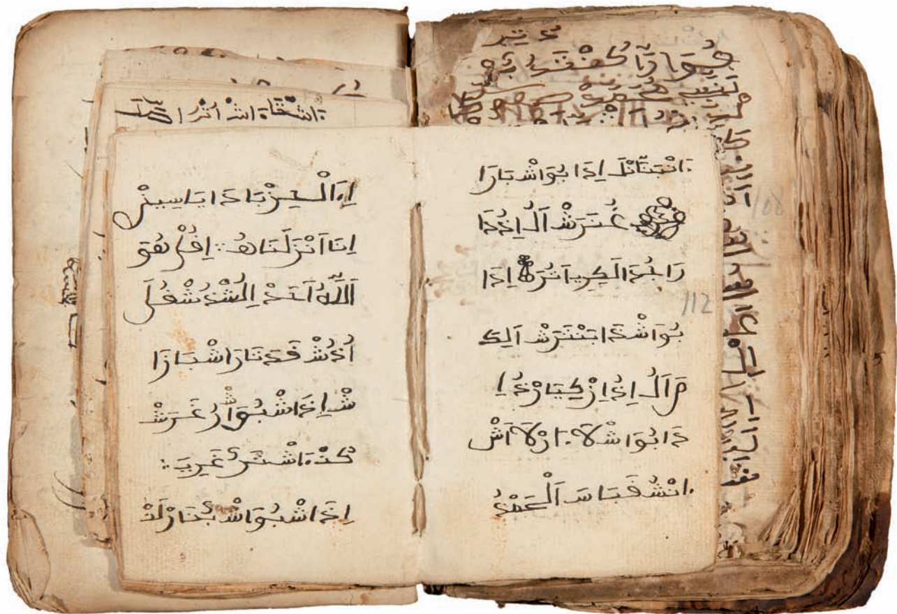
Cat. n.º 26

por tratadistas cristianos que identificaban el hecho de lavar la cabeza y frotarla con miga de pan como una forma de borrar los santos óleos, tras el bautismo: «y cuando son bautizados los laban por quitarles y raerles la crisma». Tanto en el rito islámico, como en otros rituales de nacimiento, el elemento de sacrificio representado por el animal cumple una función simbólica expiatoria, donde la res sacrificada funciona como símbolo de la expiación del pecado original. En el caso morisco, debido precisamente a las prohibiciones religiosas, se añade otra particularidad al rito, ya que además de sacrificio, que no se da siempre, es también «borradura» del origen pecaminoso cristiano (el bautismo, el nombre cristiano) y una reintroducción en la comunidad considerada legítima.