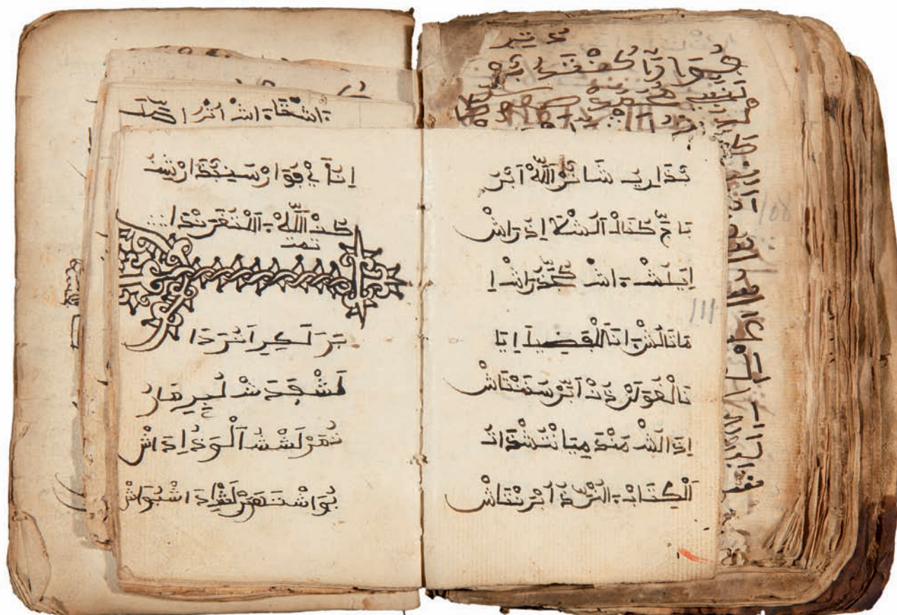
Cat. n.º 26