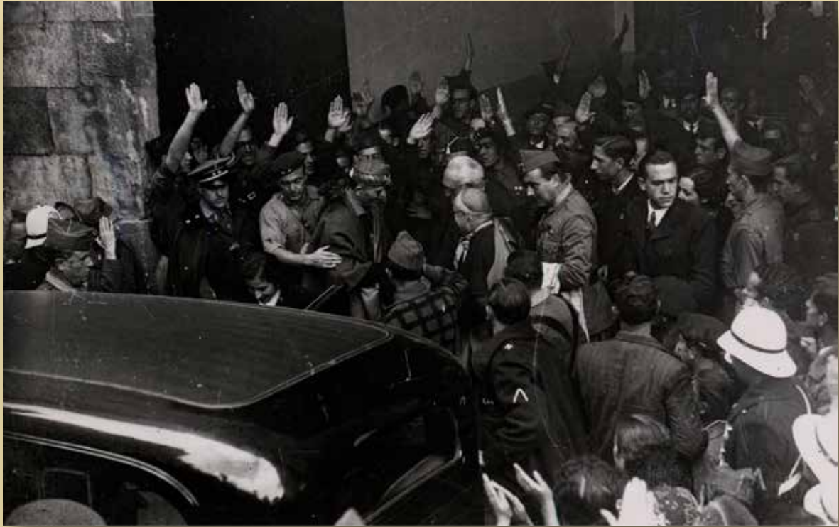
Unamuno y Pla y Deniel a la puerta de las Escuelas Mayores de la Universidad de Salamanca, tras el acto del Día de la Raza. 12 de octubre de 1936