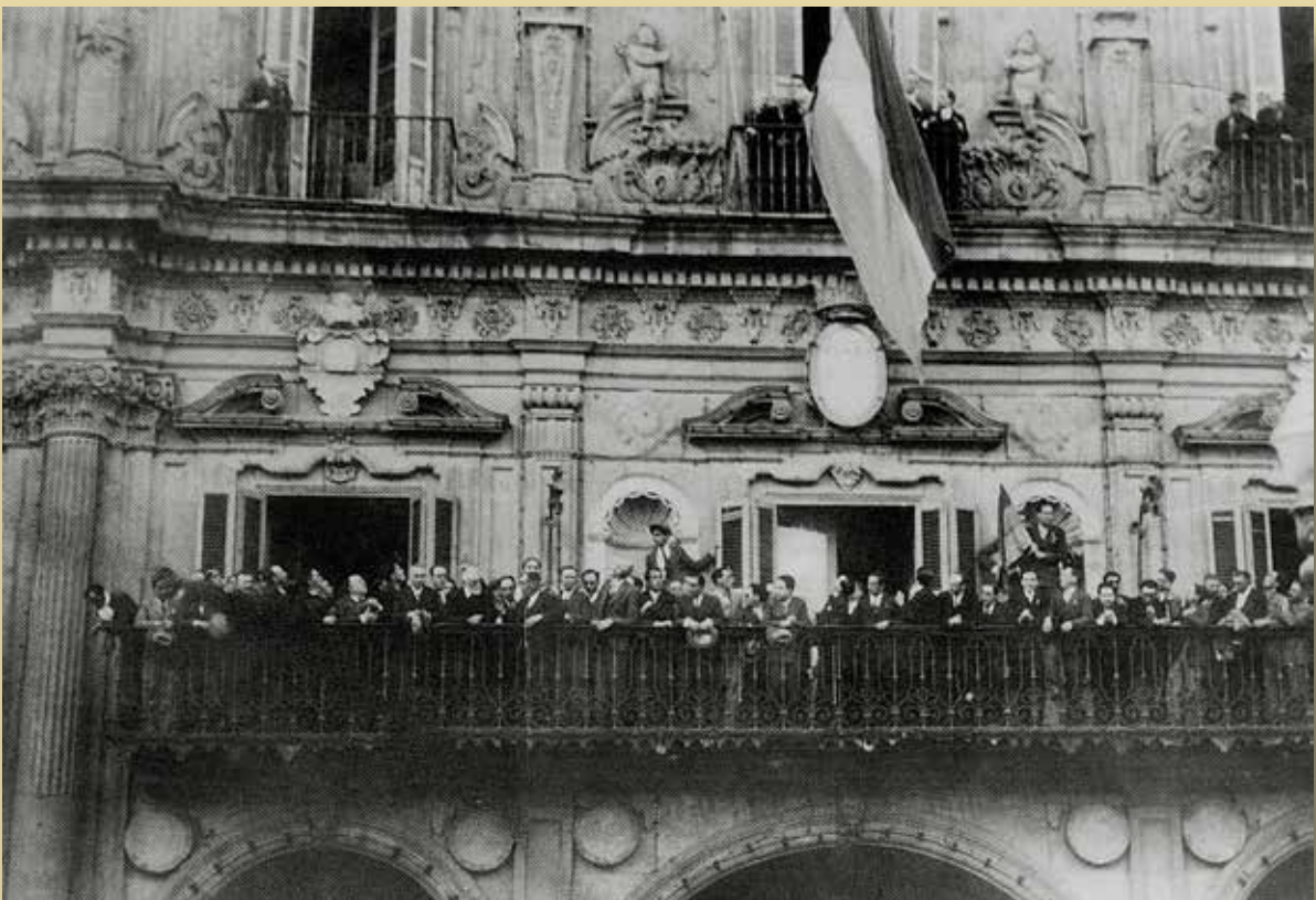
Cándido Ansede. Miguel de Unamuno proclama la República desde el balcón del ayuntamiento de Salamanca. 14 de abril de 1931 [Archivo Cándido Ansede/ Filmoteca de Castilla y León, CP-0000]

En 1931, sale elegido diputado de la joven república, pero abandona pronto su escaño en las Cortes, defraudado por los diferentes gobiernos y la brutalización de la vida política. Cuando se produce el golpe militar, hundido en un torbellino de violencia y de confusión, se adhiere durante unas semanas a los insurgentes. Pero después de su momentáneo apoyo, amplificado por la propaganda mediática de los sublevados, se alza firme y públicamente en contra de ellos durante la sonada celebración del 12 de octubre de 1936. Lo ratifica cuando apunta en su último borrador que «los hotros» —los rebeldes— son peores que «los hunos» —los marxistas—. También presagia que se avecina «una dictadura militar» y escribe poco antes de morir que «hay que renunciar a la venganza».