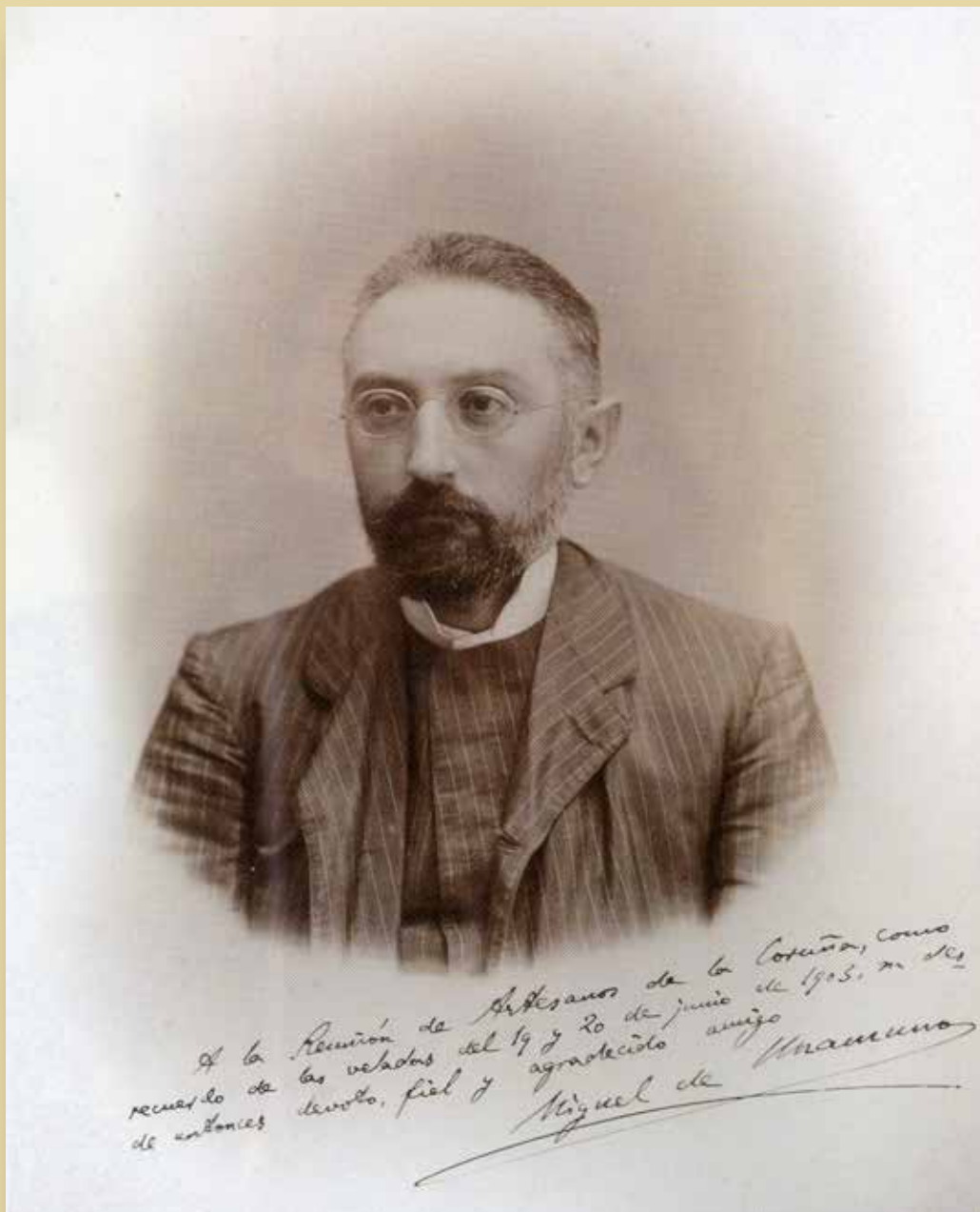
Miguel de Unamuno hacia 1902-1903

A lo largo de su extenso rectorado (1900-1914) Unamuno actúa como «predicador ambulante»: denuncia el poder de la Iglesia y sus campañas agrarias contra los terratenientes de la provincia de Salamanca provocan en gran parte su destitución. También empieza a oponerse a la monarquía en la persona de Alfonso XIII y al papel del Ejército durante la guerra de Marruecos.