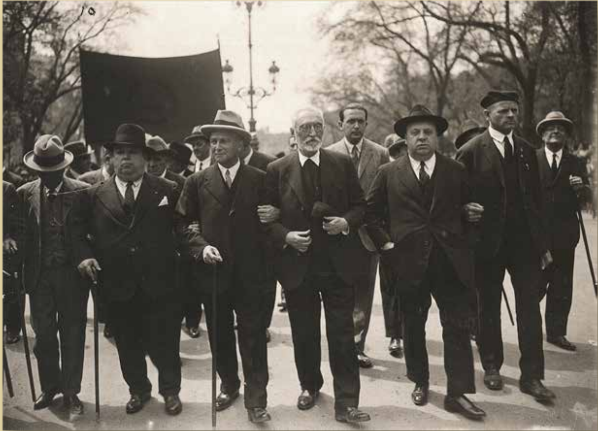
Manifestación del 1.º de Mayo de 1931. De izquierda a derecha: Pedro Rico, alcalde de Madrid; Francisco Largo Caballero; Miguel de Unamuno, Indalecio Prieto y Meelie Staal

En conclusión, esta exposición deja constancia de la coherencia y vigencia del pensamiento político de Miguel de Unamuno, intelectual comprometido que analiza y denuncia a menudo la censura, la alianza del Trono y del Altar, los nacionalismos vascos y catalán, el fascismo y el comunismo, la violencia de la vida pública; también enjuicia el papel del Parlamento, de los partidos, de la prensa e incluso las relaciones entre España y Europa.