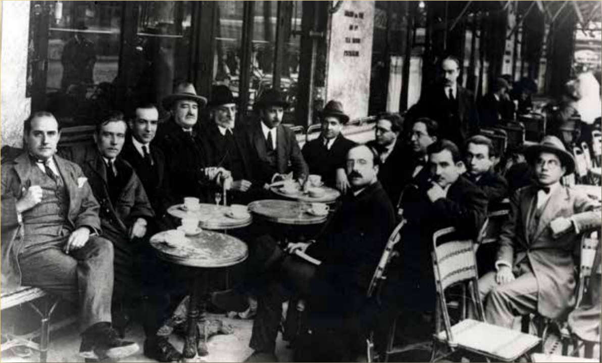
Tertulia de los intelectuales exiliados en el café de la Rotonde de París