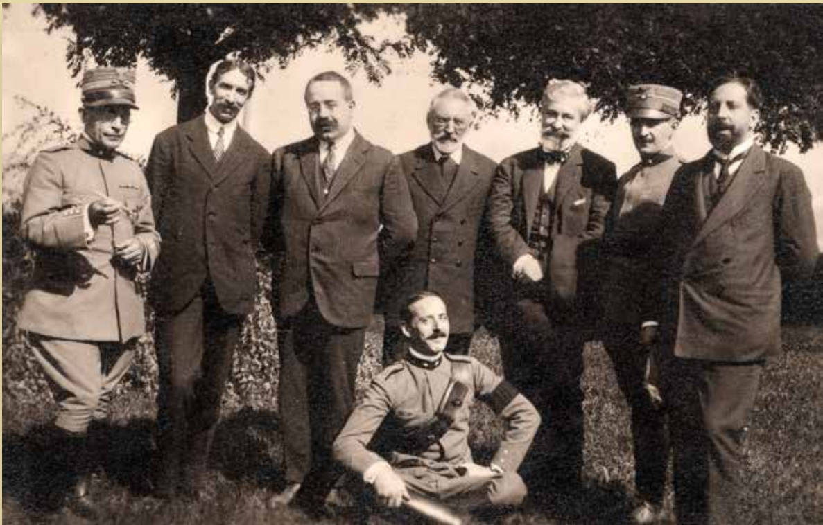
Miguel de Unamuno junto a los acompañantes de su viaje al frente italiano. Septiembre de 1917

Durante la Gran Guerra la neutralidad de España atiza su antimonarquismo y es cada vez más víctima de una censura implacable. Se refuerza su postura de intelectual europeo cuando se alza en contra de la barbarie del Ejército alemán a través de la prensa española, francesa e italiana; también se consolida su figura de tribuno. En septiembre de 1923, el manifiesto del general Miguel Primo de Rivera que inaugura una dictadura, constituye un nuevo giro en su vida.