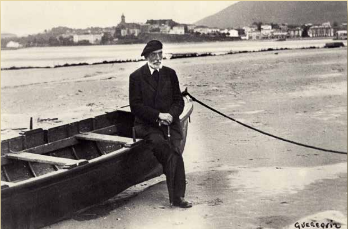
Miguel de Unamuno en la playa de Hendaya