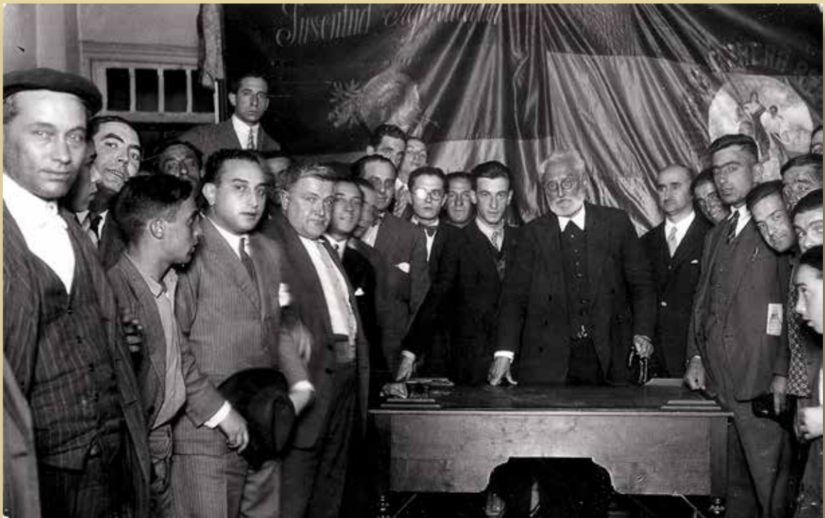
Miguel de Unamuno en el Círculo Republicano de Vitoria, 23 de septiembre de 1930. Foto: Ceferino Yanguas

[Archivo Municipal de Vitoria-Gasteiz "Pilar Aróstegui", YAN-13x18-089_25]