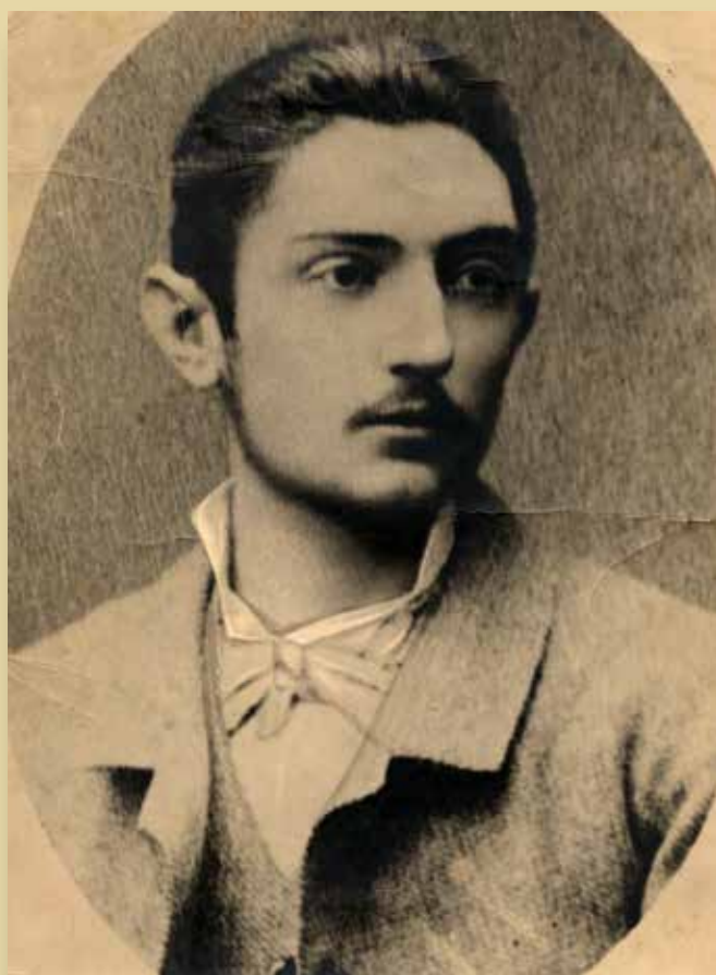
Miguel de Unamuno en 1884, recién licenciado en la Universidad Central. Foto: J. Luque AUSA_CMU,94/579,1]

Por su voluntad constante de no dejarse encasillar en cualquier partido Unamuno nunca fue un político en el sentido literal de la palabra. Con todo, se erige muy temprano en agitador de los espíritus, determinado a remediar los males de la patria, incluso en actor o guía durante las horas trágicas que vivió España. Expresa su constante deseo de «hacer opinión pública» en su ingente obra periodística. Con motivo de la guerra de Cuba y de los procesos de Montjuic se impone en el paisaje político de su país por sus posturas pacifistas y anticolonialistas.