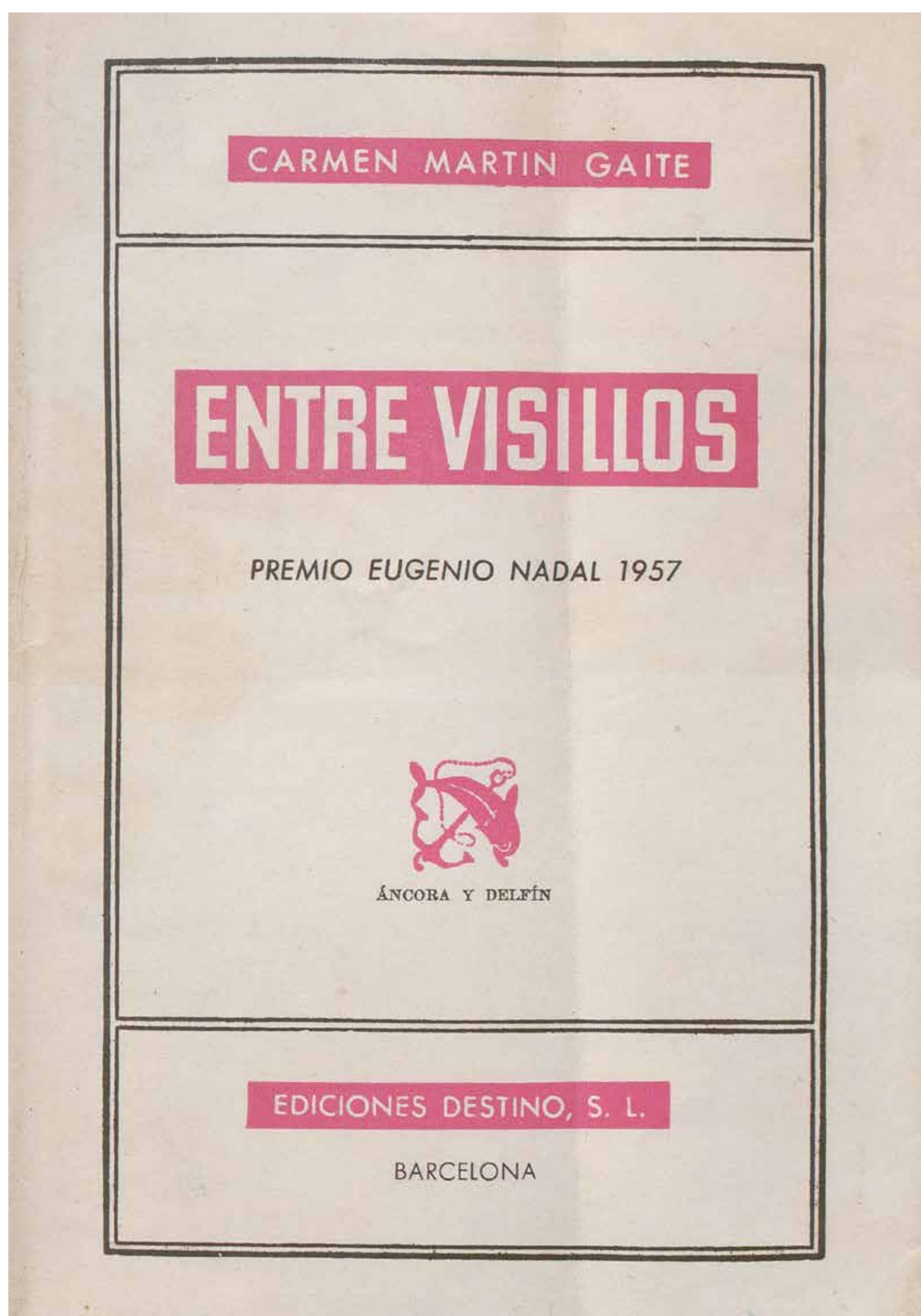
Entre visillos , Premio Nadal de 1957 (primera edición). BNE, DL/555860.