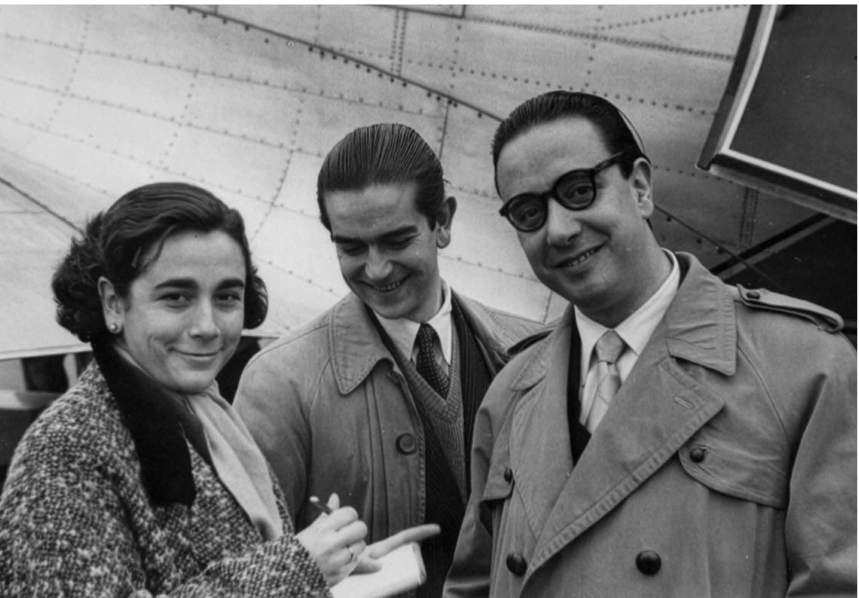
Carmen Martín Gaité, Ignacio Aldecoa y Alfonso Sastre. 1954.