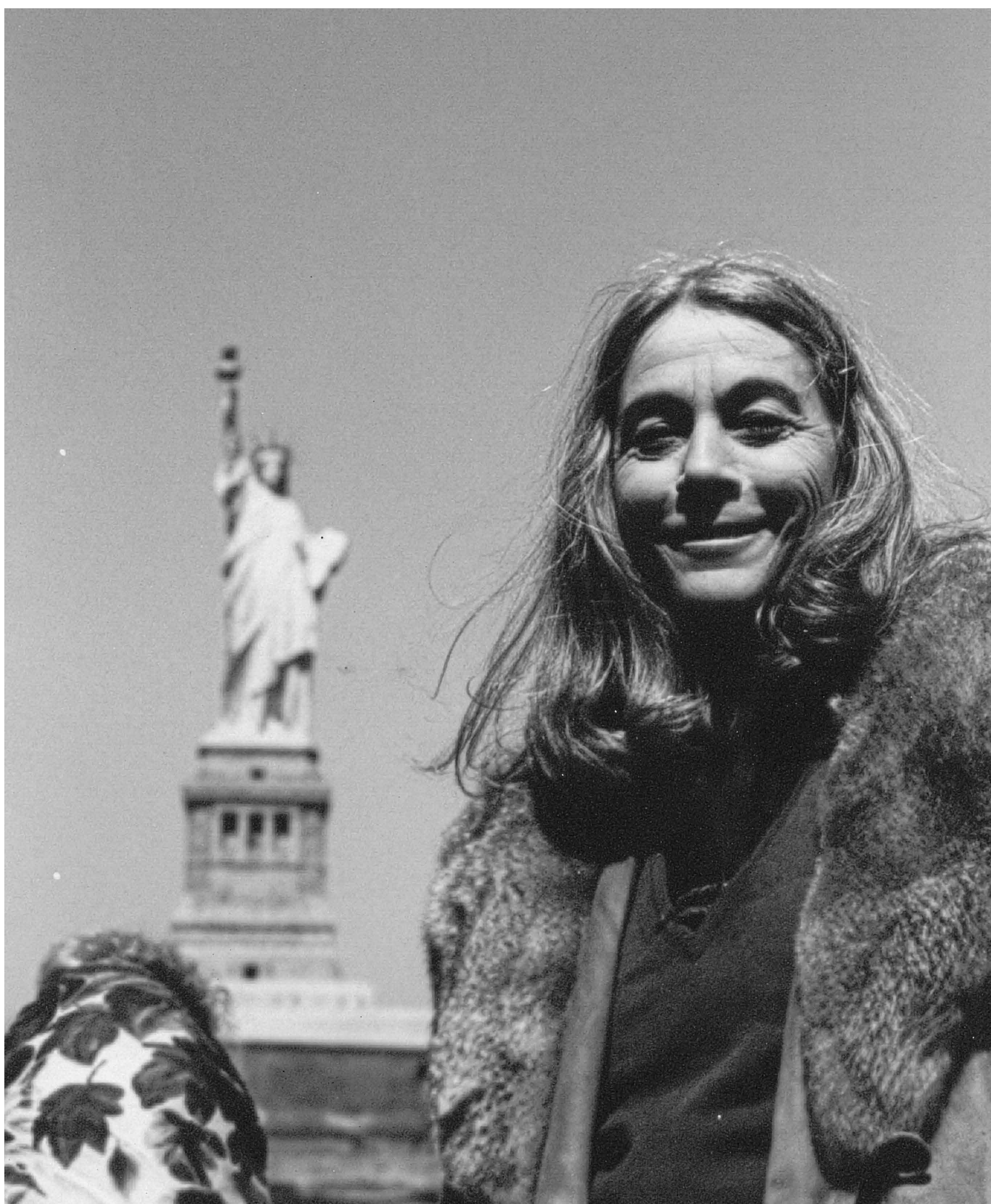
Martín Gaité visita la Estatua de la Libertad en su primera estancia neoyorquina. Abril de 1979.

El marco de referencia de su mundo literario se ordenó a través de una categoría denominada experiencia . Hasta en sus trabajos de investigación histórica o de crítica literaria tuvo la necesidad de detallarnos su particular relación con el personaje retratado, con la época objeto de estudio o con el libro reseñado. Poniendo el acento en el modo, encontró la sintonía, y buscando la manera de contarse con placer y sentido las cosas a sí misma, tropezó simultáneamente con su oyente utópico. En ella se funden interlocución y método como dos caras de una misma búsqueda.