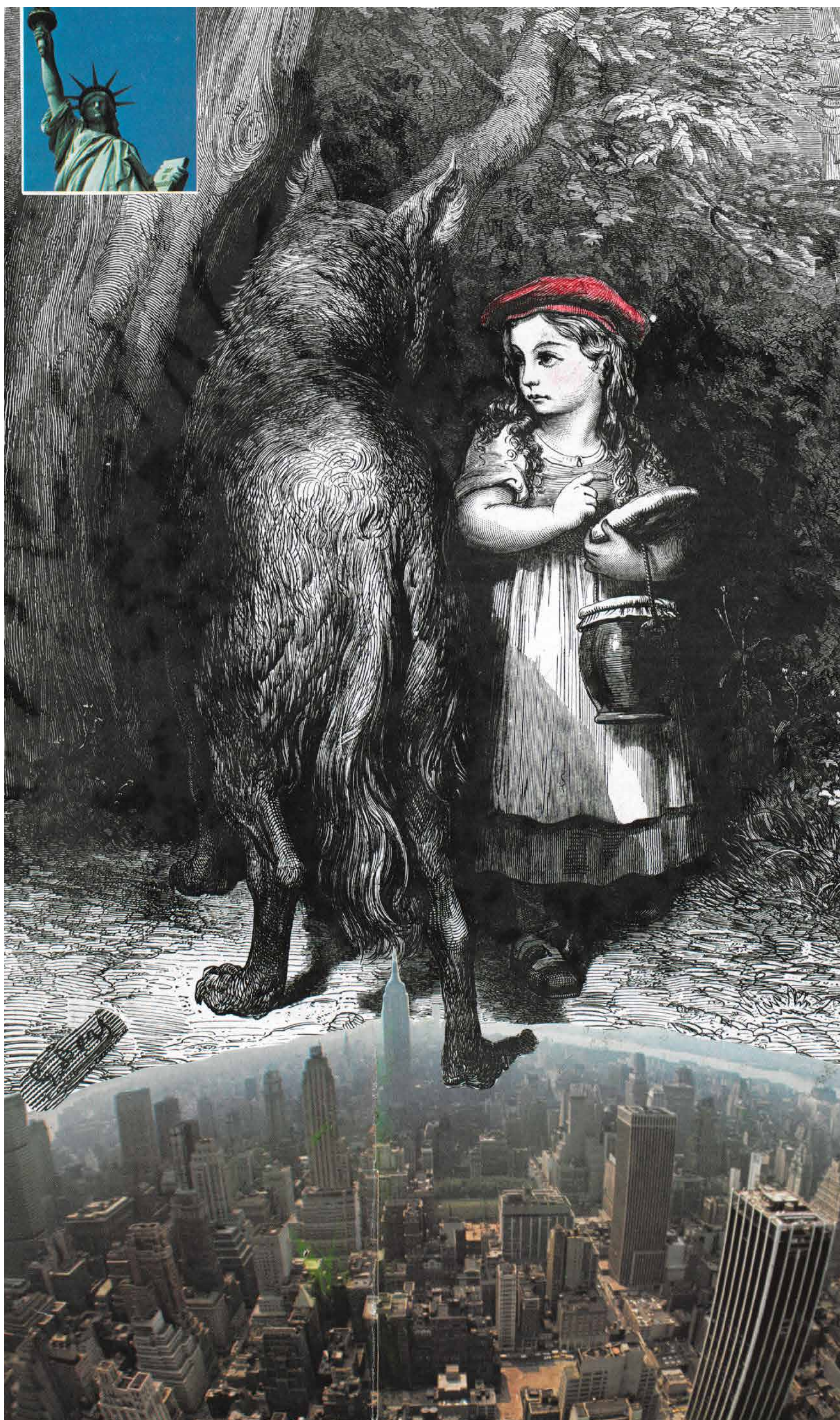
Collage para Caperucita en Manhattan (ca. 1988. «Manhattan es una metáfora del bosque donde es tan fácil soñar la libertad como perderse», escribe Martín Gaité en un cuaderno del viaje.