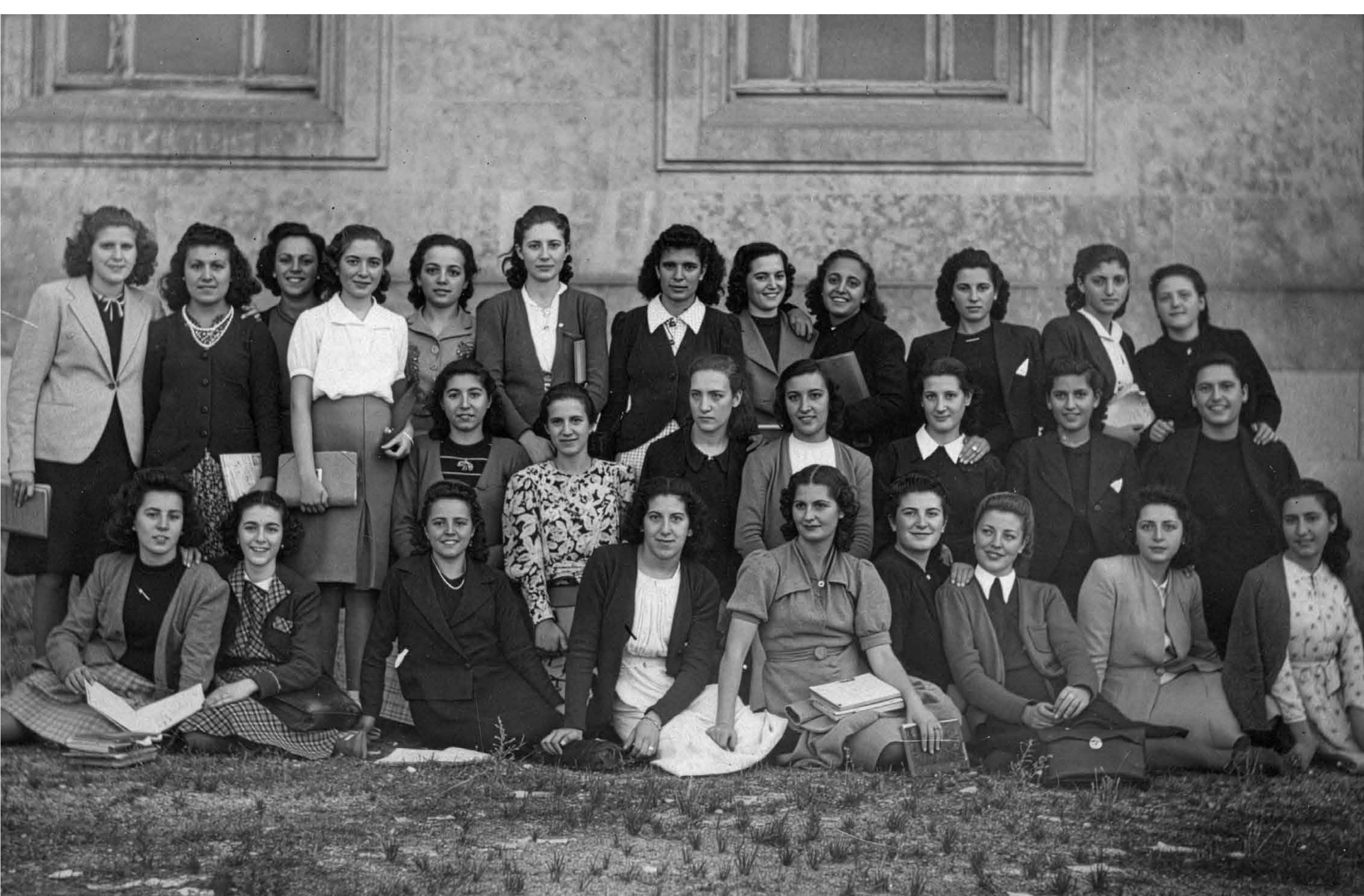
Clase de 6.º de bachillerato del curso de Carmen Martín Gaité en el Instituto Femenino de Segunda Enseñanza (Salamanca, 1941-1942).

CON UNA MIRADA PRESIDIDA POR LA CURIOSIDAD y una vocación de testigo del devenir de la España en la que le tocó vivir, la trayectoria intelectual de Carmen Martín Gaité (1925-2000) en la historia de la cultura española es un paradigma de lo que se podría llamar mujer de letras . Sus intereses literarios fueron múltiples y se desplegaron en varias direcciones: desde los géneros literarios tradicionales (cuento, novela, ensayo, poesía y teatro) a ese híbrido que su hija bautizó como Cuaderno de todo , desde la investigación histórica a la crítica literaria, desde las adaptaciones teatrales de los clásicos y los guiones para televisión a la traducción literaria de seis lenguas (inglés, francés, italiano, portugués, rumano y gallego). Es difícil encontrar otro ejemplo de una escritora con mayor variedad de intereses intelectuales en la España del siglo pasado.