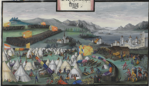
Der Strichbüch krieg