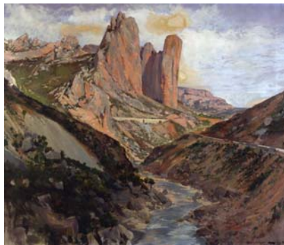
Mallos de Riglos

Espacio 4: Muerte y posteridad. Memoria e historia de Joaquín Costa. Al final, la muestra se encuentra con la muerte del pensador y las imágenes del multitudinario funeral celebrado en Zaragoza. Este espacio presenta la herencia familiar, la elaboración de la sociología de la fama y los procesos de construcción de una imagen legendaria. Se refleja, además, la diversa interpretación de su pensamiento social y político de Costa, que han trascendido hasta hoy, así como la huella dejada en el pensamiento y la realidad española. Como corolario y desde el soporte audiovisual la exposición recoge diversos testimonios y opiniones que definen los diversos perfiles de Joaquín Costa desde una visión actual.