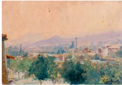
Visita desde Graus Ignacio Zuloaga y Zabaleta Colección particular

Ramón y Cajal, entre otros. Sus apuestas por la enseñanza, su vocación periodística, su ingente producción de libros -en la sala se presentan obras originales del pensador y sus coetáneos- y sus estudios sobre el Derecho se explican como una manifestación de su trabajo polifacético.